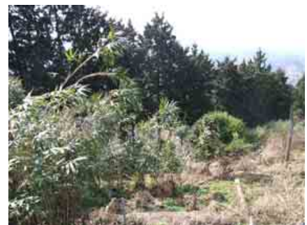
この場所を整地し、植樹します。(2009年4月撮影)