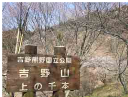
伊藤忠アーバンコミュニティの杜ができる上千本地区