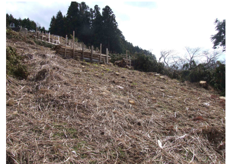
整地が完了したこの場所で植樹イベントを開催