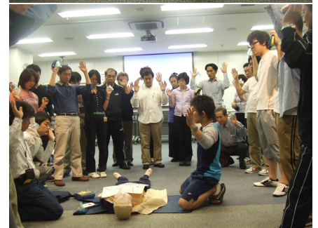
AEDを使用した実技講習