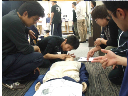
心肺蘇生法の実技講習