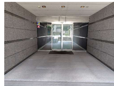
▲エントランス入口