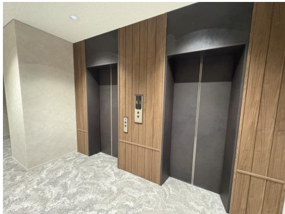
▲エレベーターホール (基準階)