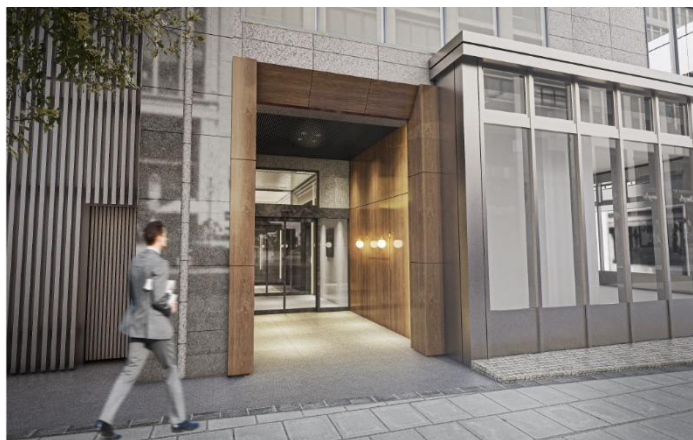
▲エントランスイメージパース (現在リニューアル中)