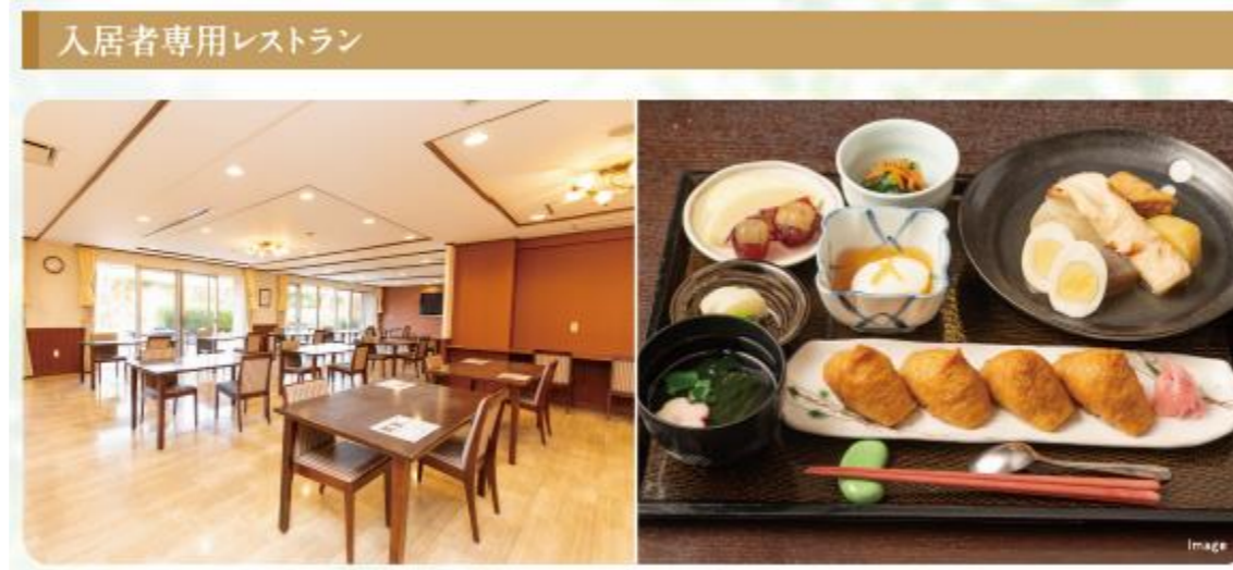
入居者専用レストラン