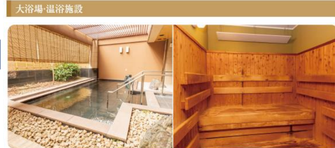
大浴場・温浴施設