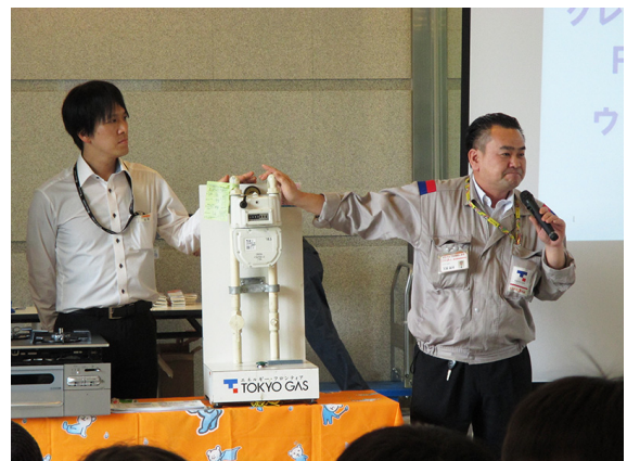
マイコンメーターの説明