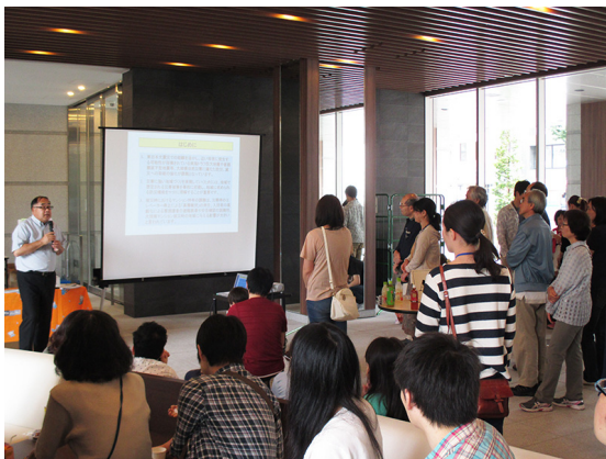
防災セミナーの様子

当社では今後も管理組合様や居住者様に行き届いた管理・運営サービスをご提供させていただくとともに、このような防災関連イベント開催を推進し、より安心・安全な生活を提供してまいります。