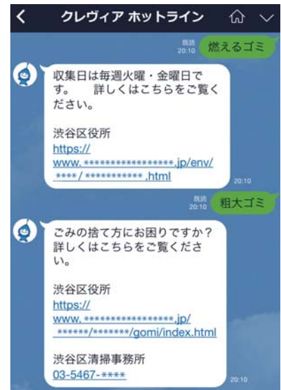
ゴミ収集日などの便利情報