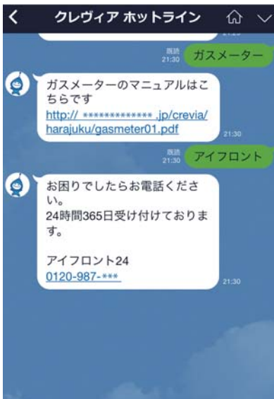
取扱説明書の閲覧 コールセンターの連絡先確認