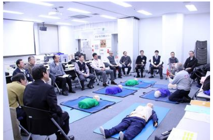
管理員研修の様子