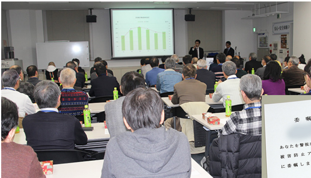
振り込め詐欺防止アドバイザー研修の様子

今後も、不動産管理会社である当社は、居住者様の身近な存在として、安心安全な暮らしを守っていくよう取り組んでまいります。