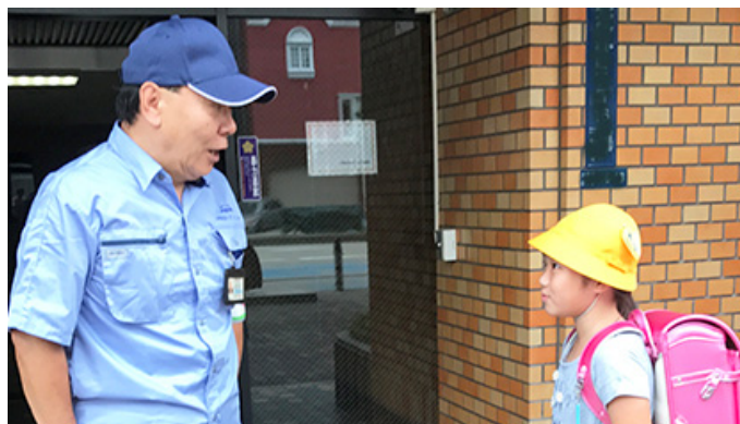
通学時の声かけの様子