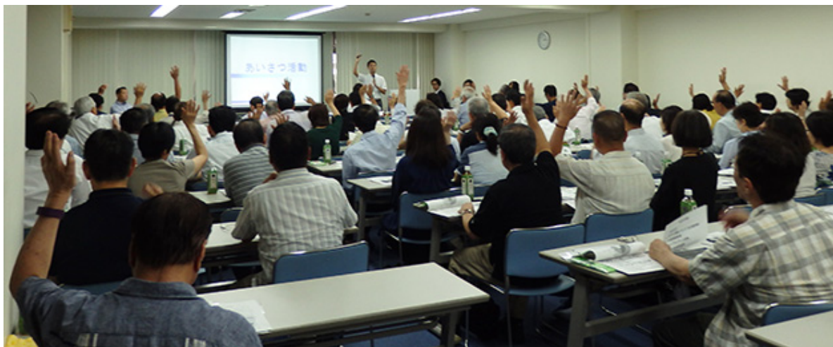
「見守り活動」研修の様子

不動産管理会社である当社は、これからも居住者様の身近な存在として、マンションあるいは地域の安心安全な暮らしに貢献できるよう取り組んでまいります。